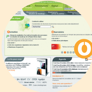
TABLEAU DE BORD 2012

Une version numérique de ce document est téléchargeable sur le site www.handiplace.org